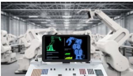
> Smart Industry